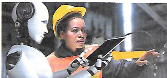
Il rapido sviluppo dell'Intelligenza artificiale rende urgente la riflessione sui temi dell'occupazione e della tutela dei diritti dei lavoratori.

V sett. di Pasqua - I sett. del Salterio.